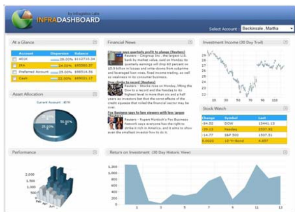
Web グリッド、グラフ、タブ、エディタ、ツリー、メニューの使用例

本製品の JSF コントロールを特長とする Executive Dashboard サンプル アプリケーションの追加によって、オンライン サンプル ブラウザが強化されました。