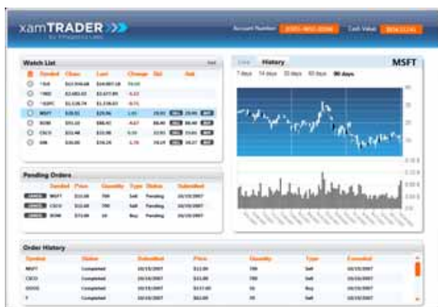
xamChart™ と xamDataChart™ の使用画面

xamEditors™ に新しく追加されたコンボボックス コントロールです。xamComboEditor™ はユーザがアイテムを選択するためのドロップダウン リストを提供するエディタ コントロールです。他の xamEditors™ と同様に xamComboEditor™ は xamDataGrid™ にプラグインが可能ですので、データグリッドやデータが設定されたセルの値を編集する際に入力ミスを防ぎ、よりユーザ フレンドリーな WPF データ ドリブンのアプリケーションを構築することができます。