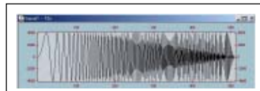
IPP を使用した信号処理のサンプル